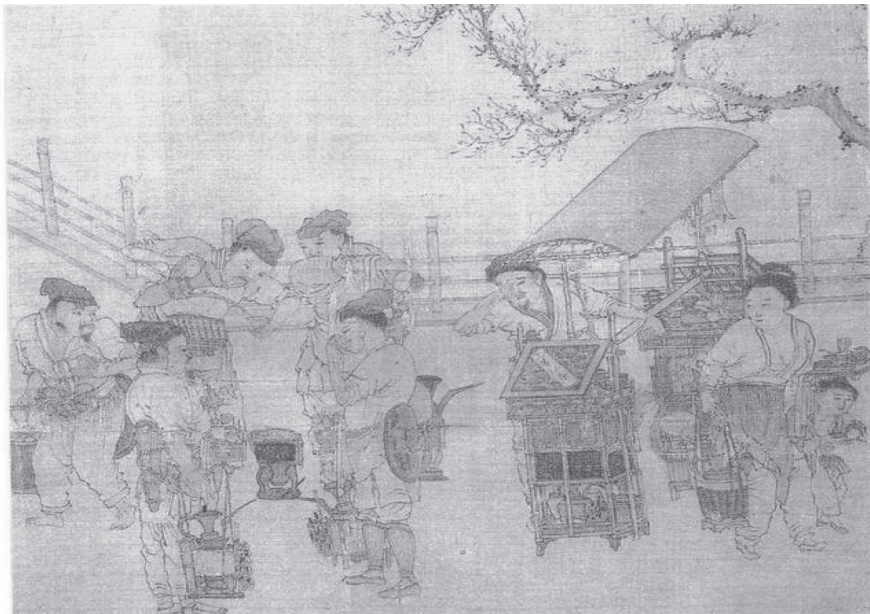
【图1】((宋)刘松年：《茗园赌市图》现藏于台北故宫博物院)

在对茶馆进行详细的考察之前，需要先对茶馆的概念进行定义，以便确定本文的考察范围。宋代的时候，茶馆的称谓还未出现，其出现是在明清时期 18) 。日本学者盐卓悟对《夷坚志》中宋代茶馆的称谓进行了统计：主要包括茶肆、茶店、茶邸、茶坊、卖茶家、鬻茶果等称谓，其中以茶肆使用频率最为普遍 19) 。但根据笔者对都市史料的统计结果【表1】来看：23例中“茶坊”的称谓有17例，“茶肆”的称谓有2例。而参考笔者对笔记小说史料的统计结果【表2】来看：15例茶馆相关史料中以“茶肆”为称谓的有13例。二者结合来看在南宋时期茶馆大多以“茶坊”，“茶肆”为称谓。为何两种不同类型的史料中关于茶馆称谓的记载会差异巨大，并且称谓的不同是否代表茶馆类型的不同等问题，笔者将会在下文中进行尝试性的分析和论述。