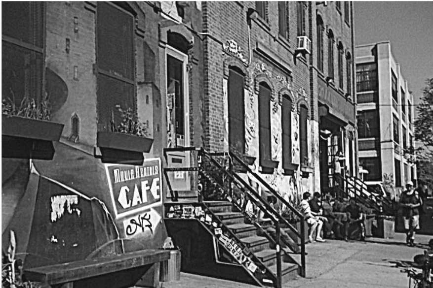
図3 ブッシュウィックの店舗

こうして、パブリックアートを見ることによって、古い創造地区では産業、エスニシティ、あるいは労働者階級の歴史への言及がないことがわかります。しかし、新しい創造地区、少なくともニューヨーク市内の地区では、産業とエスニシティは空間の外観を形作ります。これらの美学的要素は、その近隣地区に住む新しい文化生産者のアート作品、つまりその壁画、落書き、デザインを形作りさえします。[写