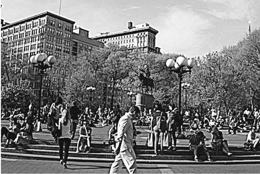
図2 グリニッチビレッジの公園

的に、ここではモザイク模様の紋章が公園の地面にはめ込まれています。そして、ブッシュウィックの高架化された地下鉄線路の下には、はるかに控え目な像があります。これらも創造地区が最初は貧しいということを示しています。この地区はあまり財政支援されていません。この地区で見られる国家が助成しているアートでも同じです。[写真を見せて]これが別の種類のモニュメント的なアートで、いわゆる「アストロ・キューブ」です。意図的にこのように均衡を保っています。このアートは様々な解釈ができます。このモニュメント的なアート作品についての一つの解釈の仕方は、それが非政府組織、一種の非営利の文化組織によって支援されていたというものです。もう一つの解釈の仕方は、この傾きが創造地区の歴史を象徴しているというものです。私のお気に入りには、このモニュメントが示しているのは、この縁でぐらつきながらどちらかに倒れるかもしれないという、本当の創造地区と高級で高価な創造地区の間で均衡を保つ近隣地区という解釈です。[写真を見せて]これは私が住んでいる地区にあるモニュメント的なパブリックアートのもう一つの例です。これらモザイク画の作品は米陸軍の元兵士が装飾として作ったものです。彼はホームレスになってイーストビレッジの路上に彼の犬と20年ほど暮らしていましたが、自分の使命としてこれらの公共空間を装飾し、このケースではニューヨーク消防局を、また彼自身がモニュメントにしたいものは何であれ、記念するために一組のモザイク画を作成しました。し