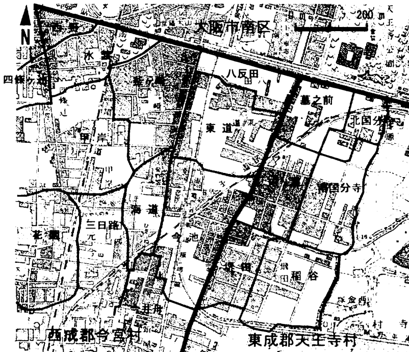
図2 1921年の釜ヶ崎近辺の状況 (地名は1910年現在の村名・小字名。1万分の1「大阪南部」1921年割図に加筆)