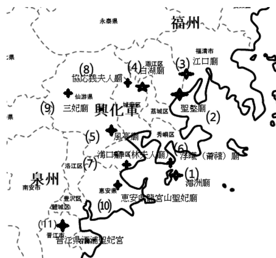
地図A：福建沿海地域

第一に、福建沿海地域、広東沿海地域、江浙・江淮沿 海地域という三つの区域に集中している。福建沿海地域 においては十一カ所の祠廟があり、特に起源地の興化軍 に九カ所あり、泉州と漳州境内には二カ所以上ある。興 化軍とりわけ莆田県が媽祖信仰の中心地域と言っても過 言ではないだろう(地図A参照)。江浙・江淮沿海地域 においては六カ所があり、都の臨安府に三カ所あり、鎮