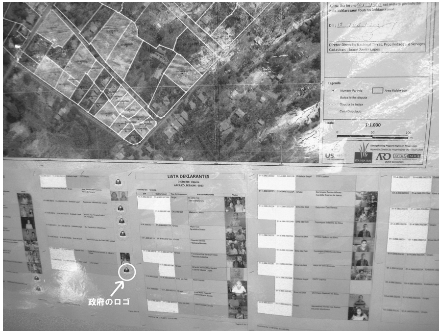
写真1: デイリ市内に掲示された地籍調査の結果の一部

〔2011年9月15日 筆者撮影。実際の写真で赤色で表示されている部分を白色に変えて掲載。上の写真の白い斜線部は権利請求者が重複し係争が存在する区画。画面の下半分には、各区画の権利請求者の写真と氏名が掲載されている。白色は係争があることを示し、政府マークの右側に白色が付いている場合は国有地に権利請求者が存在することを示している。〕